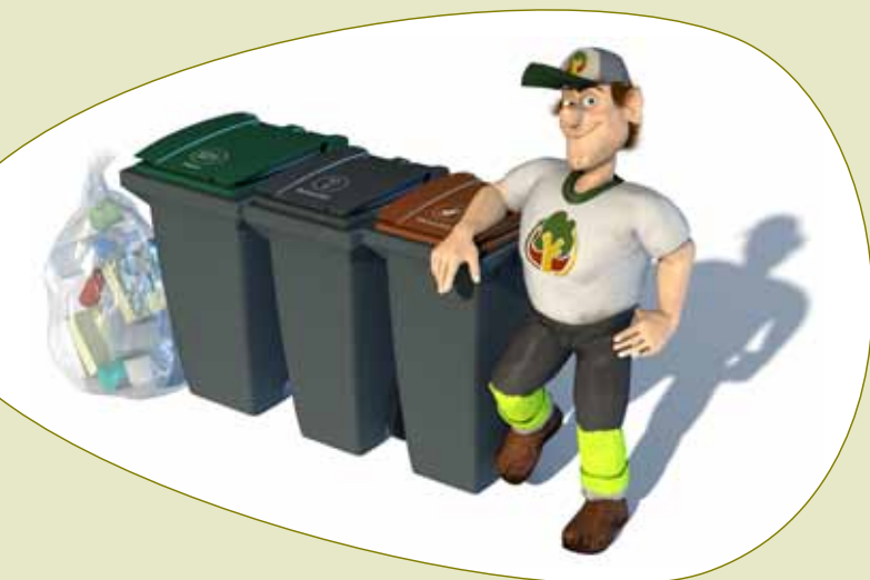
Reinholdt og de nye utebeholderne

Husk at når du kildesorterer avfallet ditt blir det bedre plass i restavfallsbeholderen!